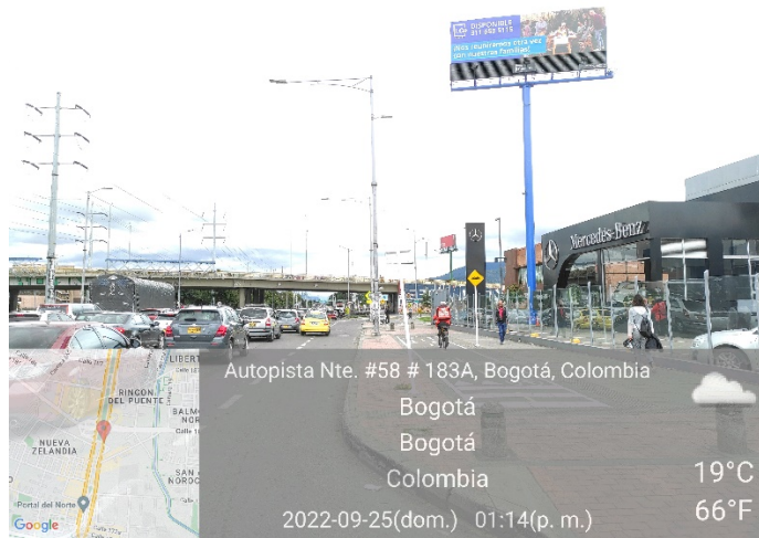
Foto No. 1 – Vista panorámica del predio, mástil, paneles y la estructura de la valla, ubicada en la Av. Carrera 45 No. 183 A - 58 (dirección catastral), orientación SUR – NORTE .