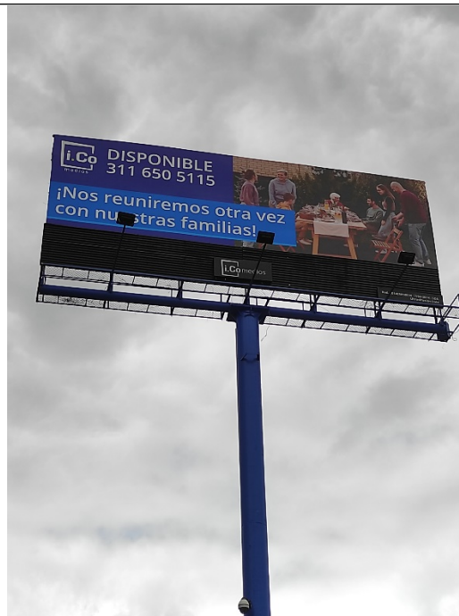
Foto No. 2 – Vista del panel orientación Sur Norte y de la estructura de la valla, en buenas condiciones y estable.